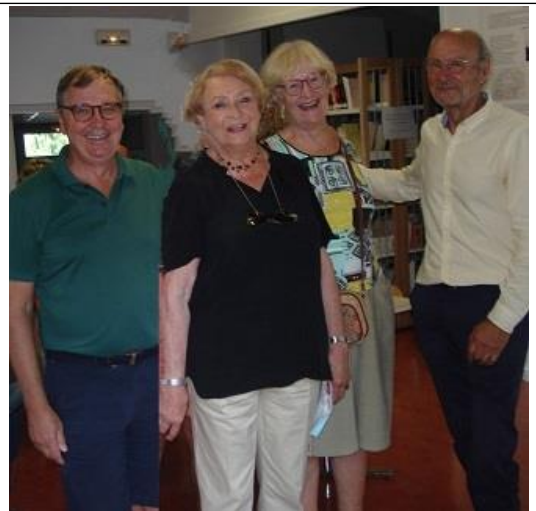
La SHAAPB était bien représentée lors de l'inauguration de l'exposition sur les Abatilles

Reprise de nos permanences du mercredi au 2 ème étage du MA.AT. Vous pourrez échanger avec nos administrateurs et y consulter les ouvrages de notre bibliothèque. Nous vous y attendons donc les mercredis 1 er , 8, 15, 22 et 29, de 14h30 à 17h. Nos portes seront ouvertes au public ce samedi 4 au titre du forum des associations de 10 à 17h30.